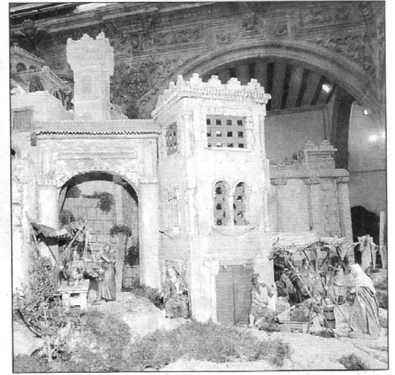
Una visitante contempla el belén municipal que se ha instalado en el Palacio de Guevara. Al lado, detalle de uno de los monumentos que lo conforman.